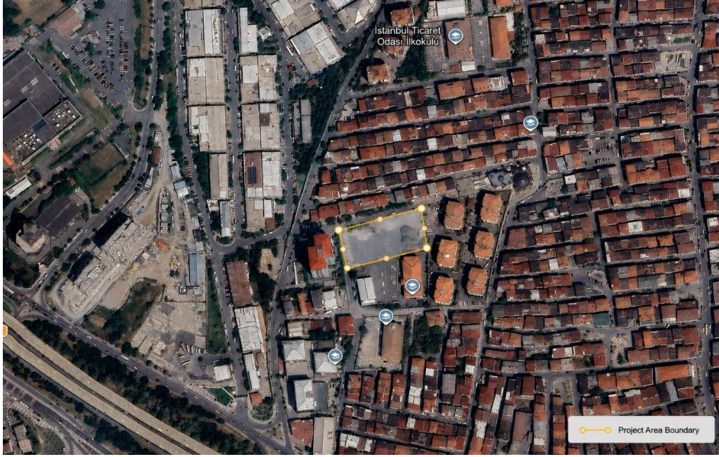
Şekil 1: Bağcılar Ortaokulu'nun Genel Görünümü (Bağcılar, İstanbul)

Ek 3 (Arazi Kayıt Belgeleri), proje alanının resmi tapu bilgilerini, parsel ve blok numaraları, toplam arazi alanını (9.846,28 m 2 ), arazi kullanım tanımını ("Meslek Lisesi Alanı") ve Hazine ve Maliye Bakanlığı'na kayıt dahil olmak üzere sunmakta olup, kamu mülkiyetini ve eğitim amaçlı Milli Eğitim Bakanlığı'na tahsisi doğrular. Ek 4 (Topografik Araştırma), sahanın mevcut cephesi, sınırları ve fiziksel özellikleri hakkında ayrıntılı bilgiler sunarak yeni okul binasının tasarımı ve düzenini destekler. Ek 5 (İmar Durumu Yazısı) arazi kullanım tanımının resmi onayını içerir ve alanın ilgili imar planları kapsamında İlköğretim Tesisi Alanı olarak planlandığını doğrular.