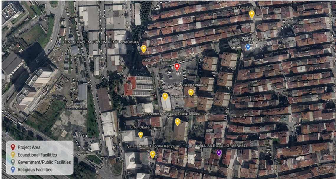
Bağcılar Ortaokulu Etki Alanı