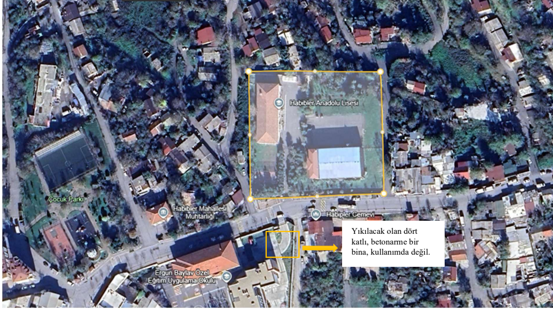
Şekil 1: Habibler Anadolu Lisesi'nin Genel Görünümü (Sultangazi, İstanbul)

(İmar Durumu Yazısı) arazi kullanım tanımının resmi onayını içerir ve alanın ilgili imar planları kapsamında Ortaöğretim Alanı olarak planlandığını doğrular.